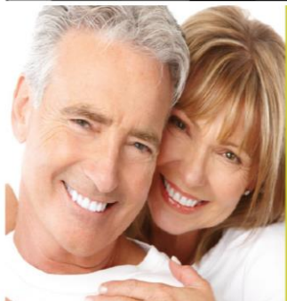
De Zwolse Tippelaars

Kamperstraat 6-8, 8011 LM Zwolle Tel. 038 - 421 58 98 Fax 038 - 422 20 86 Geerdinksweg 137-9, 7555 DL Hengelo Tel. 074 - 259 37 47 Fax 074 - 259 37 48